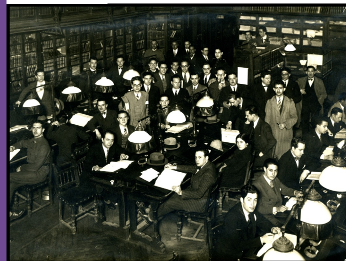
Ateneístas en la Biblioteca Sala de "La Pecera" (1930)